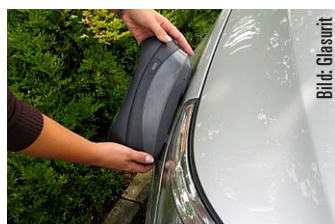
Schneller Farbtonmesser: Der neue Ratio Scan II von Glasurit «liest» den exakten Farbton direkt an der Karosserie.

Die Vielfalt und Komplexität von Farbtonen macht die Farbtonfindung für die Autoreparaturlackierung zunehmend schwieriger und kostet die Carrosserien oft wertvolle Arbeitszeit. Mit dem neuen Farbtonmessgerät Glasurit RATIO Scan II ist jetzt endgültig Schluss damit. Das tragbare und batteriegespiesene Messgerät misst den Farbton exakt und führt mittels eines angeschlossenen Software-Programms schnell und einfach zur gewünschten Mischformel. Besonders für grosse Lackierbetriebe