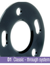
D1 Classic - through system