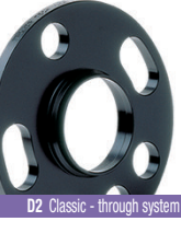
D2 Classic - through system