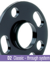
D2 Classic - through system