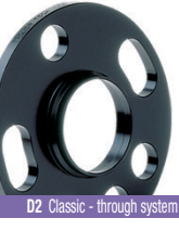
D2 Classic - through system