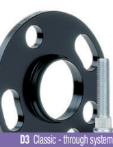
D3 Classic - through system (for cars with wheel stud (order studs separately))