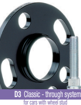
D3 Classic - through system (for cars with wheel stud order studs separately)