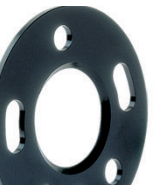
D1 Classic - through system