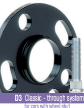
D3 Classic - through system for cars with wheel stud (order studs separately)