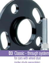
D3 Classic - through system (for cars with wheel stud (order studs separately))