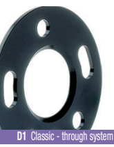
D1 Classic - through system