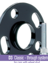
D3 Classic - through system (for cars with wheel stud order studs separately)