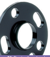
D2 Classic - through system