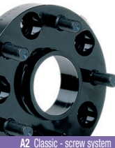
A2 Classic - screw system