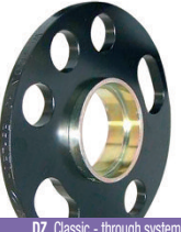
DZ Classic - through system with centering, 2-pc