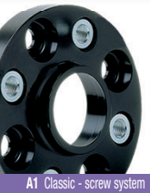
A1 Classic - screw system